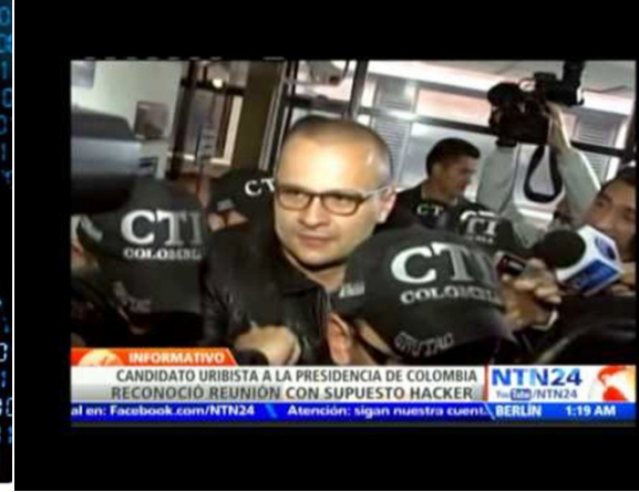
Noticias de prensa