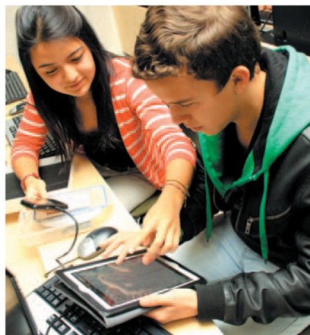
En el Laboratorio de Computación Móvil estudiantes de pregrado, maestría y doctorado disponen de los elementos necesarios para desarrollar sus soluciones de concepción móvil.

Durante la carrera, el estudiante aprende a reconocer la necesidad de elaborar soluciones móviles exitosas que sobrevi-