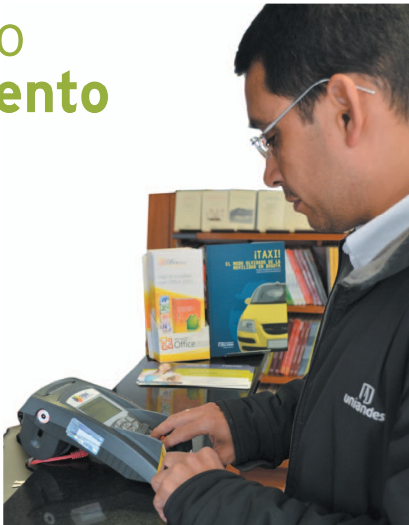
La cantidad de datáfonos en Colombia es baja: 150.000 en todo el país y muchos de ellos se concentran en las grandes ciudades. Masificar la tecnología ayudará a fortalecer el comercio electrónico.

Los pagos electrónicos son seguros si los usuarios tomamos las medidas adecuadas; algunas de ellas son: