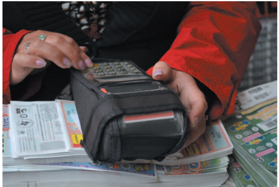
Los loteros emplean dispositivos móviles para sus ventas.