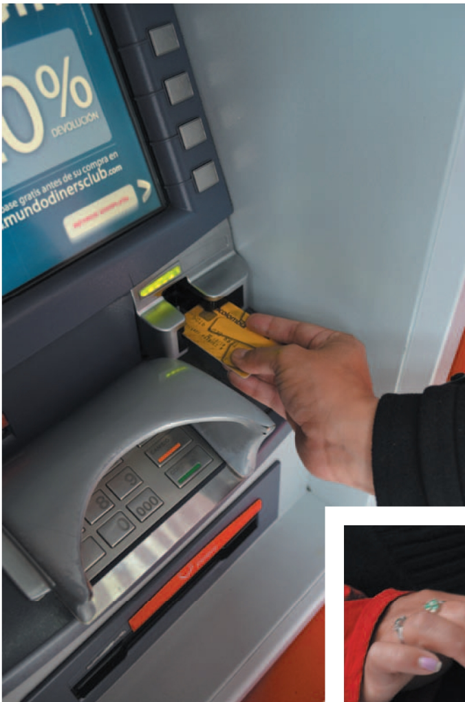
En Colombia hay 11.000 cajeros automáticos y 1.032 municipios.

Temas como mercadeo, seguridad y acceso a los pagos electrónicos han sido tratados en los foros organizados por el Departamento. Todos ellos configuran los retos de Colombia para ponerse a la par de otros países de la región.