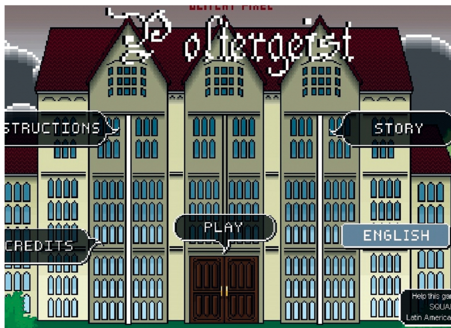
Imagen de Poltergeist , un juego basado en que asustar es divertido.

Este trabajo conjunto contrasta con lo que sucedía hace seis años, cuando las iniciativas eran pocas y las empresas se mostraban recelosas a compartir sus secretos. ■